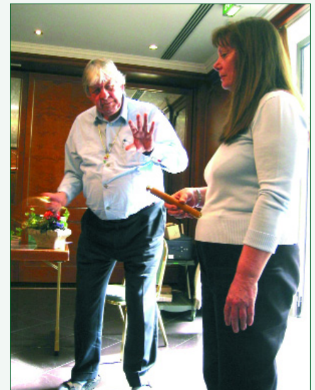
Abb. 4: Ein Stimmungsbild aus dem Seminar, das keines Kommentars bedarf

Auf den gleichen Erkenntnissen fußt der Raum-Harmonizer, der ein gesundes, physiologisches Raumklima schaffen soll. So verzeichne die See-Luft einen Anteil an Minus-Ionen von 60 % und einen Anteil von Plus-Ionen von 40 %. Die Stadtluft enthalte genau das