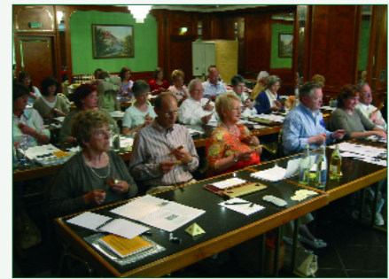
Abb. 3: Die Seminarteilnehmer/innen erleben das Zusammenspiel von Bioantenne und Yin-Yang-Energizer