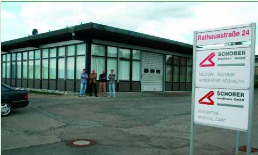
Abb. 6: Die Zentrale der SCHOBER medicare GmbH in Hechingen

Vorbereitung des Österreichischen Fußball-Nationalteams auf die Europameisterschaft in Österreich und der Schweiz.