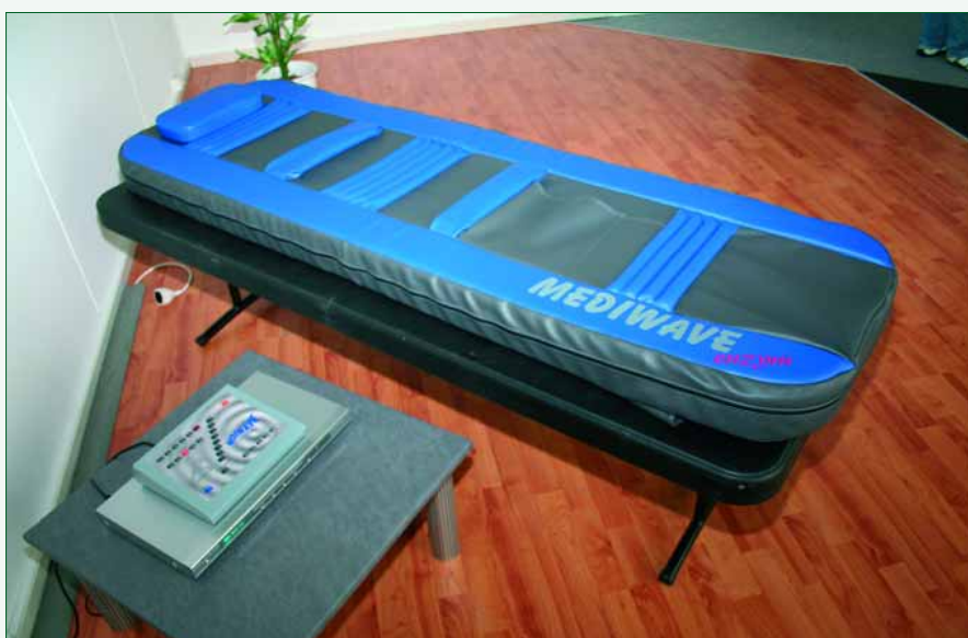
Abb. 1: Heilende Töne, interessantes Design: MEDIWAVE

Eine völlig neuartige, ganzheitliche Interventionsform ist auf dem Weg, die Naturheilkunde zu erobern. Dem auf den ersten Blick simplen Gedanken, Töne als Schall-schwingungen direkt auf den Körper, auf die Haut zu applizieren, könnte die Erkenntnis auf dem Fuße folgen, dass die wahren großen Dinge zunächst meist im Verborgenen und im Unscheinbaren blühen. CO`MED will sich mit einem Porträt über die vielfältigen Wellness- und Therapie-Möglichkeiten der Heilenden Töne daran beteiligen, dieses zarte Pflänzchen erstmals dem Licht der interessierten und fachlichen Öffentlichkeit auszusetzen.