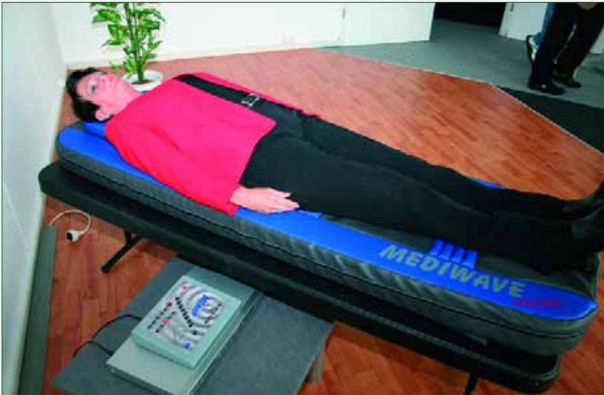
Abb. 4: Die Therapie mit den „heilenden Tönen“ wird sofort als wohltuend und entspannend empfunden

sentlich vereinfacht und reduziert, eine grobe Übersicht über die Wirkfelder dieser Programme: