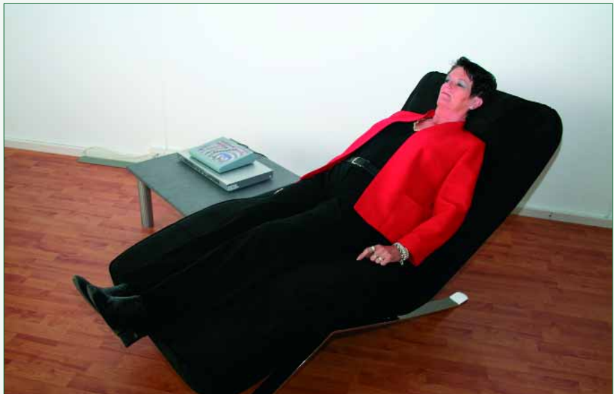
Abb. 3: MEDIWAVE, in der exklusiven Wellness-Ausführung