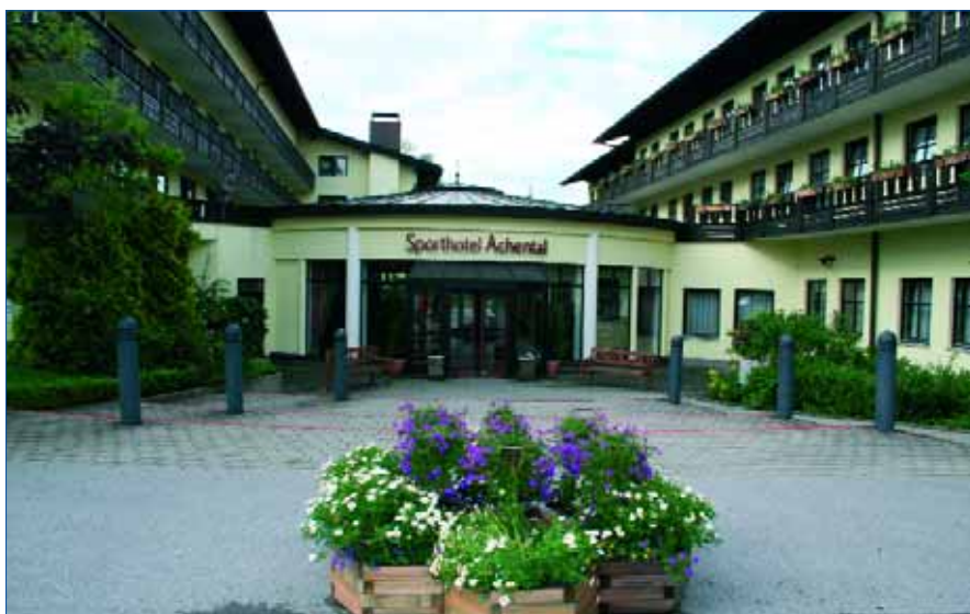
Abb. 1: Das Sporthotel Achental

Der erste Teil dieses Porträts über die Esogetische Medizin in der Ausgabe 10/2007 versuchte, einen ersten Einblick in die Grundlagen der Esogetischen Medizin zu ermöglichen und insofern das Fundament für das Verständnis des Seminar-Porträts zu liefern. Der zweite Teil führt nun direkt in das Seminar hinein und beschreibt dabei weitere Grundlagen der esogetischen Medizin.