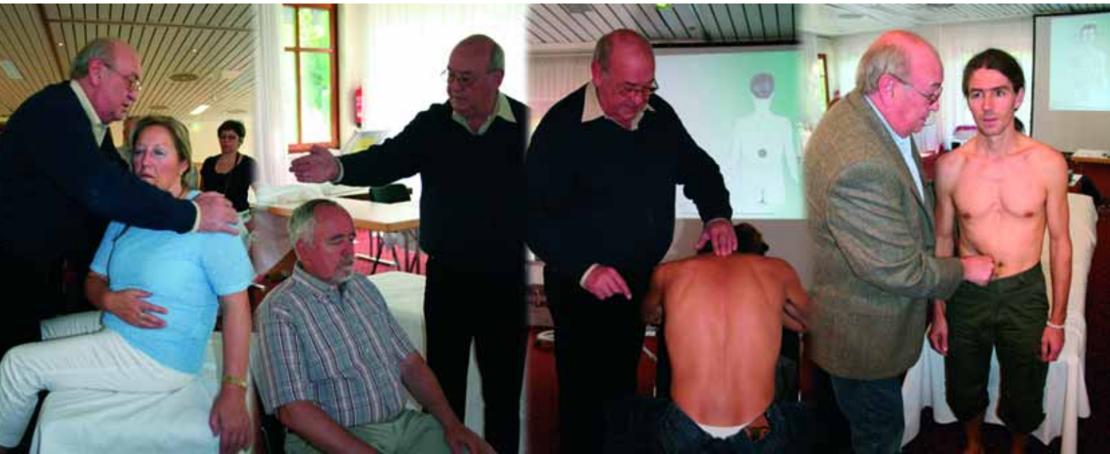
Abb. 4: Seminar-Praxis zum Zweiten

Wie wir heute wissen, haben wir ein zweites Gehirn im Darm, welches mehr Impulse zum Kopfgehirn sendet als es von dort erhält. Bei einem durch permanenten Stress erzeugten Druck auf den Solarplexus – so Peter Mandel – kommt es zu einem Säureüberschuss im Magen, der folglich das Milieu von Dünn- und Dickdarm verändert. In der Folge bedeutet dieses, dass die durch Dis-Stress verursachten Gefühlsschwankungen zwangsläufig zur Schwächung des Immunsystems führen. Die schon erwähnten Schlafrythmusstörungen verhindern wiederum auf Dauer die Regeneration von Körper und Nervenzellen und führen dadurch langsam, aber sicher, zu schweren Krankheiten.